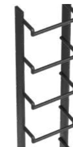
ÉCHELON (POUR OD 800 SEULEMENT)