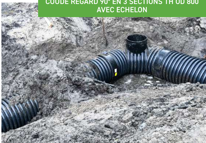
COUDE REGARD 90° EN 3 SECTIONS TH OD 800 AVEC ECHELON