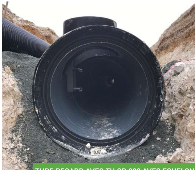
TUBE REGARD AVEC TH OD 800 AVEC ECHELON