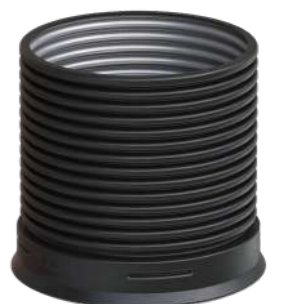
RÉHAUSSE (POUR OD 630 ET OD 800)