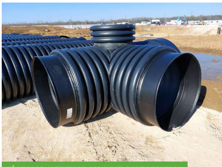
TÉ REGARD AVEC TH OD 930 ANNELE AVEC ECHELON