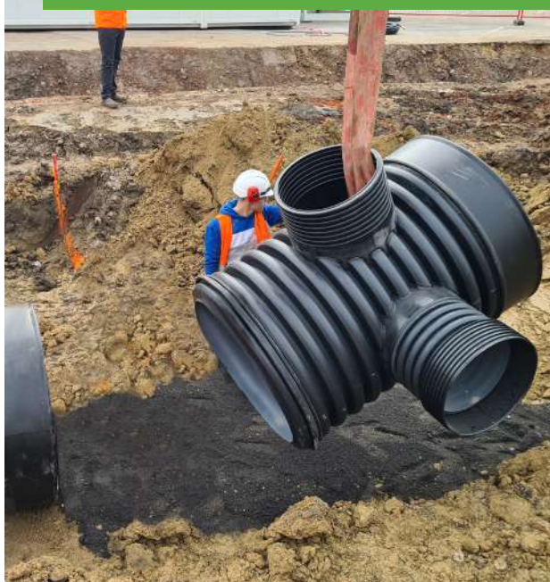
TUBE REGARD AVEC TH OD 630