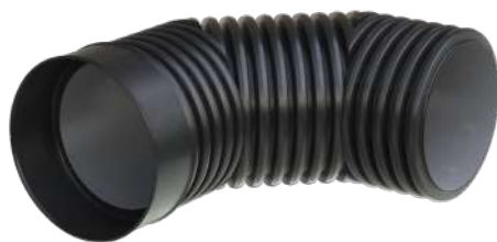
COUDE 3 SECTIONS 90°