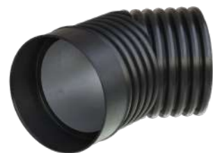
COUDE 2 SECTIONS 45°